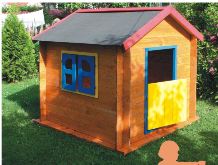
7 zahradní domek s tabulí