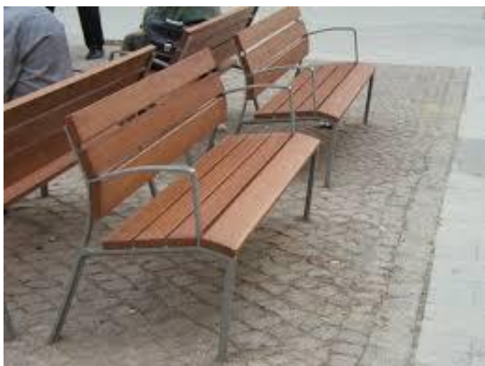
8 lavička s opěradlem