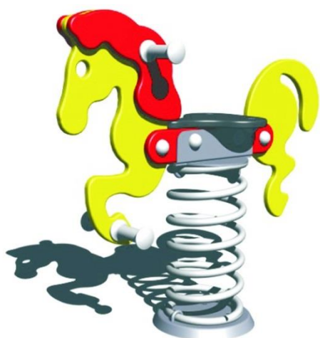
1 pružinové houpadlo