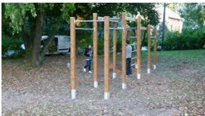
9 cvičební hrací systém