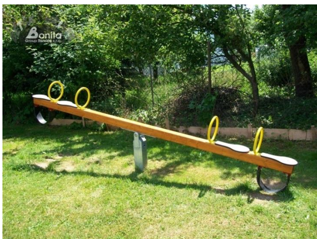
3 vahadlová houpačka čtyřmístná