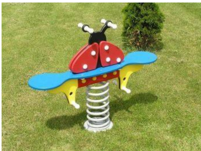
2 dvojitá pružinová houpačka