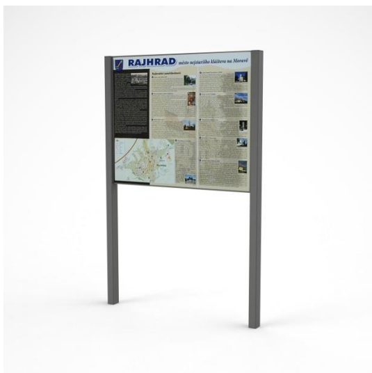
9 kovová informační tabule s označením hřiště

Tyto dodatečné informace budou zaslány všem známým účastníkům a zároveň zveřejněny na webu zadavatele.