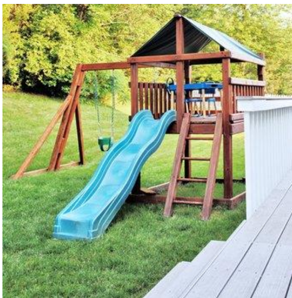
4 prolézačka 4m